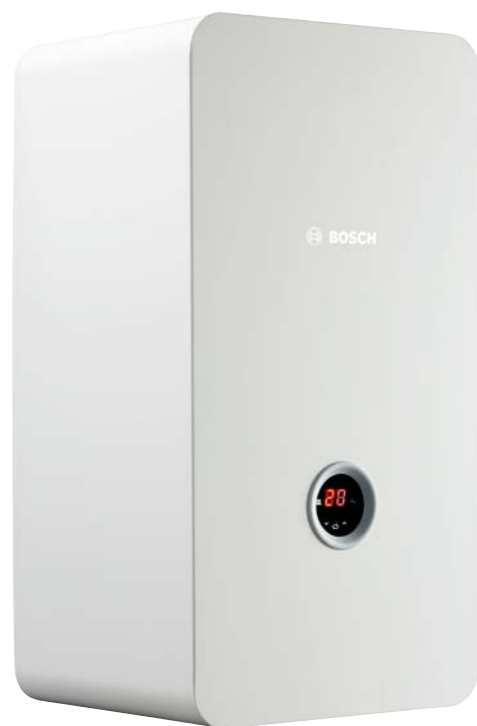
Tronic Heat 3000/3500